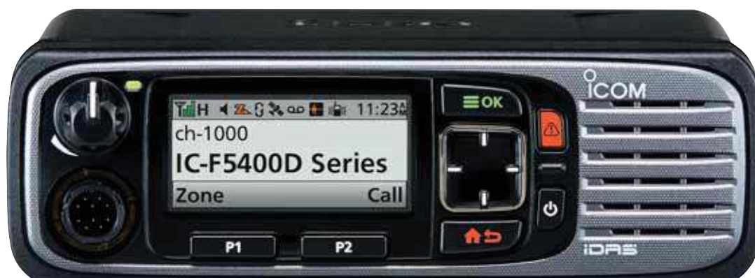
IC-F5400D (VHF) IC-F6400D (UHF)