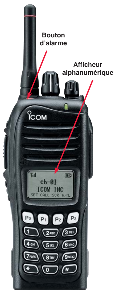
▲ Portatif radio présenté avec antenne courte (option)