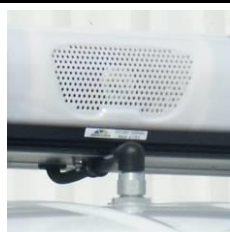
Prise de toit étanche