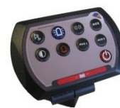
Pack CCS8 : Systèmes de commandes centralisées pour les véhicules spécifiques