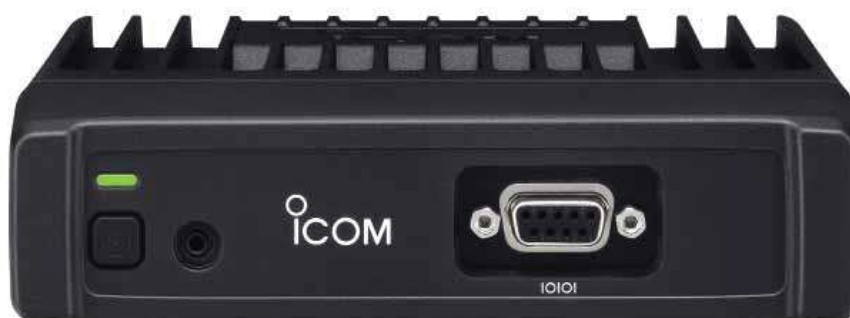
Versions RS-232 (protocole série) : IC-F5122DD #3 (VHF) IC-F6122DD #3 (UHF)