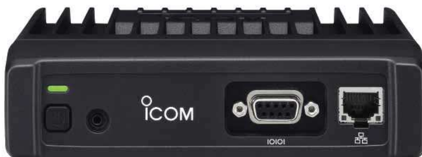
Versions IP (Ethernet) et RS-232 (protocole série) : IC-F5122DD #13 (VHF) IC-F6122DD #13 (UHF)

Il s'agit de systèmes de télégestion à grande échelle permettant de traiter en temps réel un nombre important de télémesures et de contrôler à distance des installations techniques (système de contrôle et d'acquisition de données).