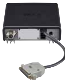
Installation du câble Sub-D OPC-2078 en option

* Pas de modulation numérique “IN” lors de l’utilisation des câbles accessoires, le poste accepte seulement de l’audio analogique.