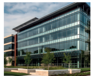
Bâtiments publics, hôpitaux...