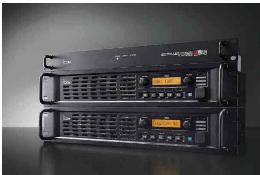
Relais IF-FR5100D220VG & Contrôleur FC5000E